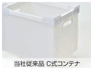
当社従来品 C式コンテナ