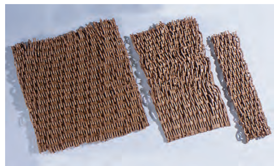
巾100mm~450mmまで自在に調整