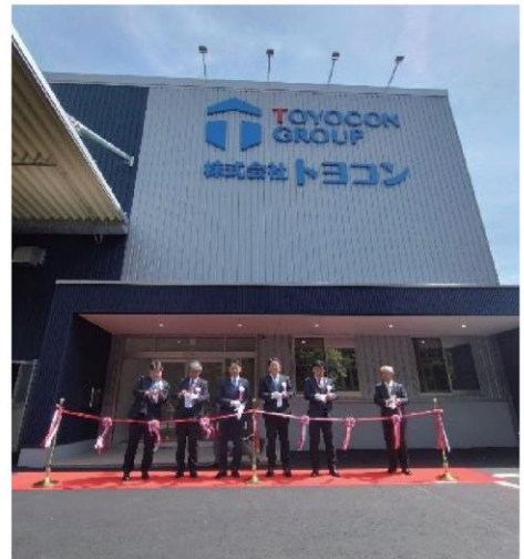
豊川ロジテックセンター竣工式 所在地：愛知県豊川市上長山町